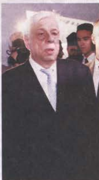
Ο Πρόεδρος της Δημοκρατίας Προκόπης Παυλόπουλος εγκαινιάσε το Ψηφιακό Μουσείο Σμύρνης και Νέας Σμύρνης που συνδέει το παρελθόν με το παρόν και το μέλλον.

1. Εξέλιξη της περιοχής και της πόλης της Σμύρνης. Εδώ ο επισκέπτης έχει τη δυνατότητα να οργανώσει την αναδρομή στην ιστορία της Σμύρνης επιλέγοντας χρονική